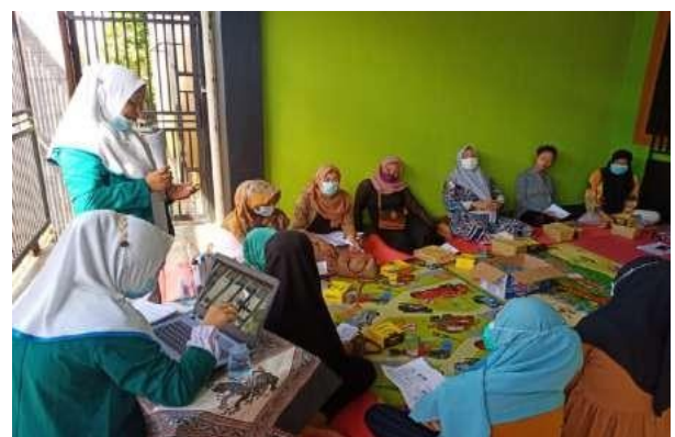
Gambar 2: Proses penyuluhan

Berdasarkan asumsi pengabdian tindakan edukasi anemia yang merupakan transfer pengetahuan dari pengabdian kepada peserta sehingga peserta memperoleh peningkatan pengetahuan tentang anemia pada ibu hamil. Meningkatkan pengetahuan ibu hamil mengenai pencegahan anemia upaya menurunkan anemia pada ibu hamil.