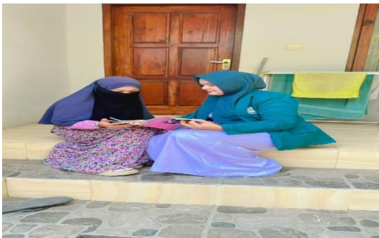
Gambar 4: Diskusi dengan menunjukan leaflet dan buku KIA.