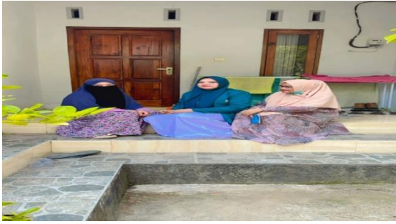
Gambar 3: Proses pemeriksaan kesehatan pada ibu hamil sebelum di mulai penyuluhan